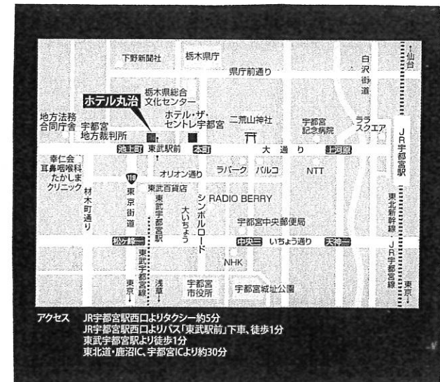
アクセス JR宇都宮駅西口よりタクシー約5分 JR宇都宮駅西口よりバス「東武駅前」下車、徒歩1分 東武宇都宮駅より徒歩1分 東北道・鹿沼IC、宇都宮ICより約30分

■交通のご案内 ●東北自動車道 ●JR宇都宮駅(路線バス、コンセーレまで4.7km) ●鹿沼ICより、9.5km ●開業バス(作新学院線生行き1(6)番のりば)